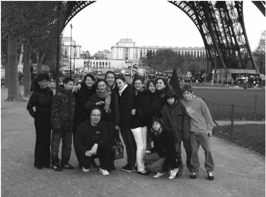
Paris, Festival du Cirque de Demain, 2-3 février 2008