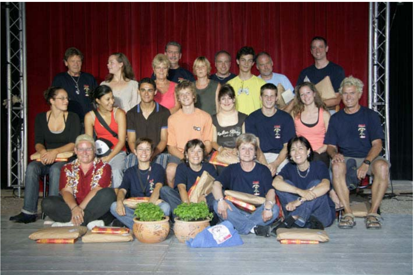
L'équipe des joyeux organisateurs et bénévoles