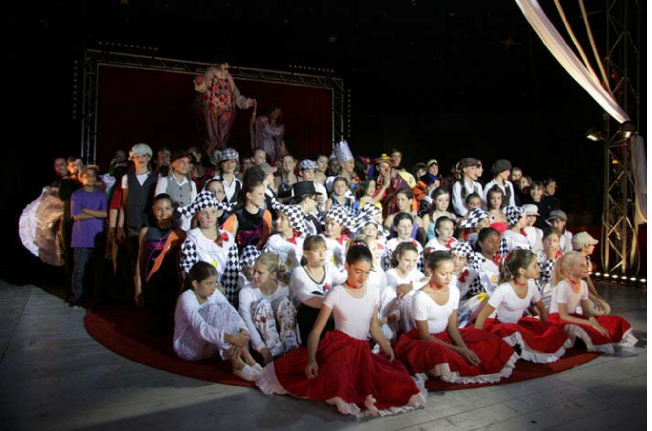
Le final du spectacle B