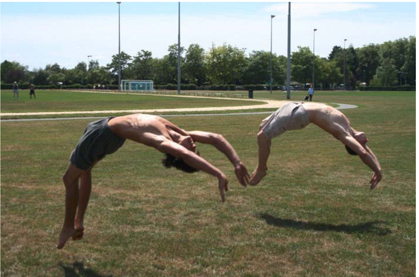
Et on se mesure l'un à l'autre...