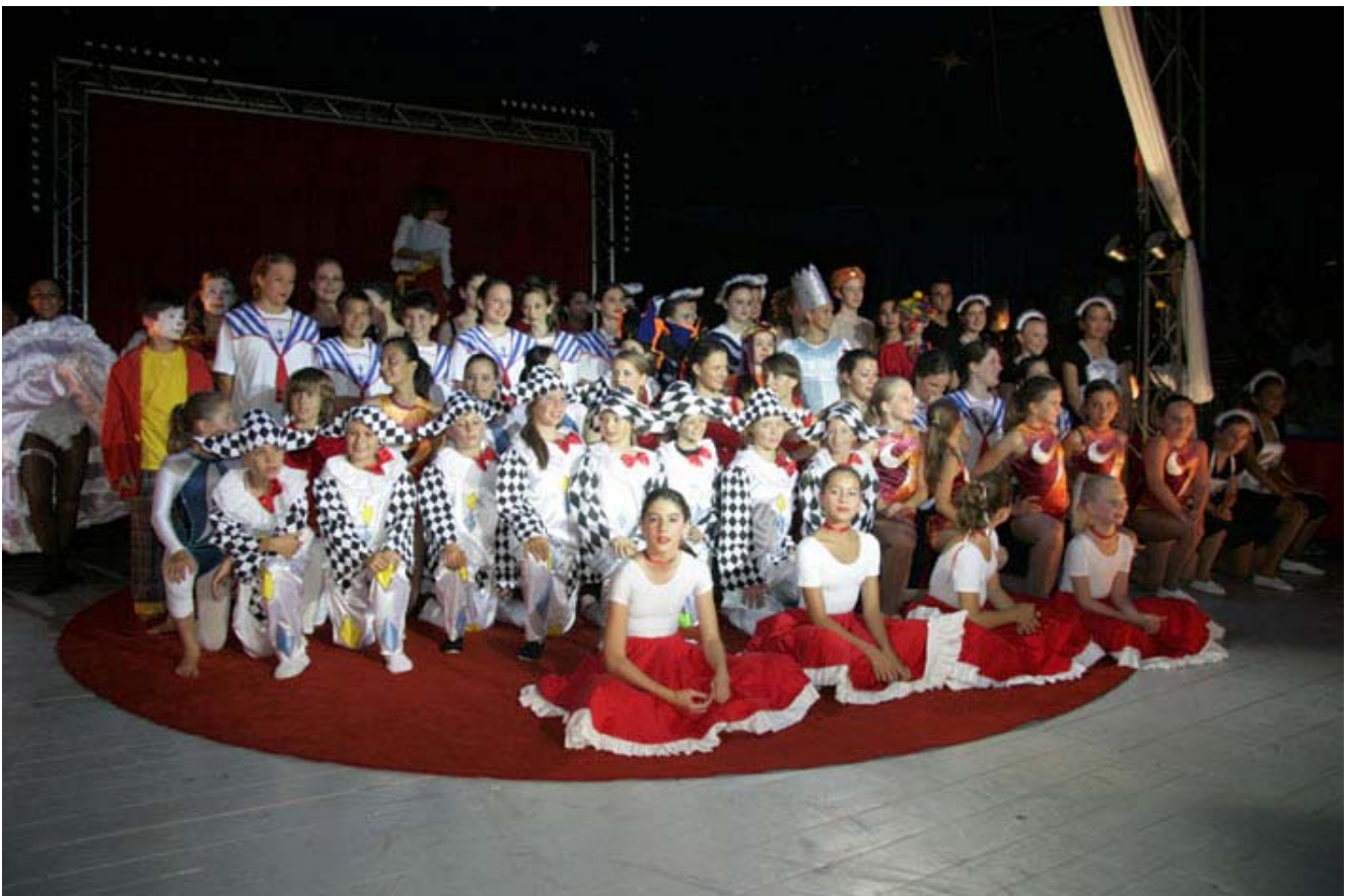
Le final du spectacle A

MERCI A TOUTES ET TOUS D'AVOIR CONTRIBUE A LA REUSSITE DE CETTE FETE !