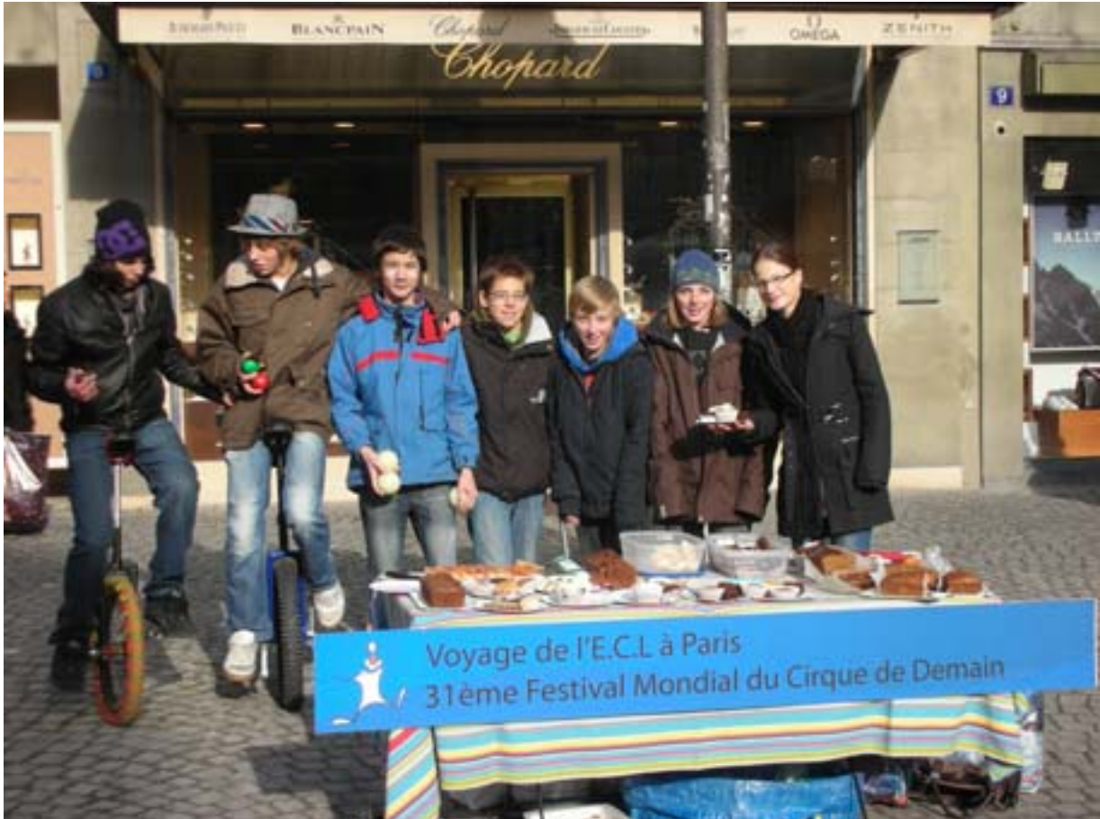
L'équipe de pâtisserie au complet Un peu de monocycle ou de jonglerie ont attiré les chalands