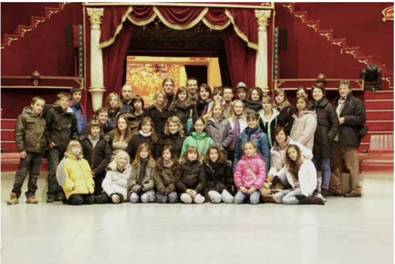
Toute l'équipe sur la piste du Cirque d'hiver sauf la photographe Odile qui se cachait derrière son appareil

Chacun gardera certainement un excellent souvenir de cet épisode Parisien.