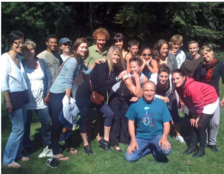
L'équipe du pique-nique de fin de vacances à Vidy