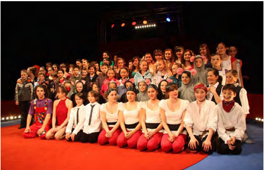
Final spectacle B