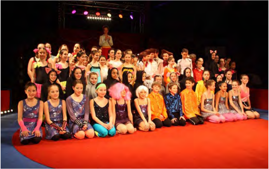
Final spectacle A