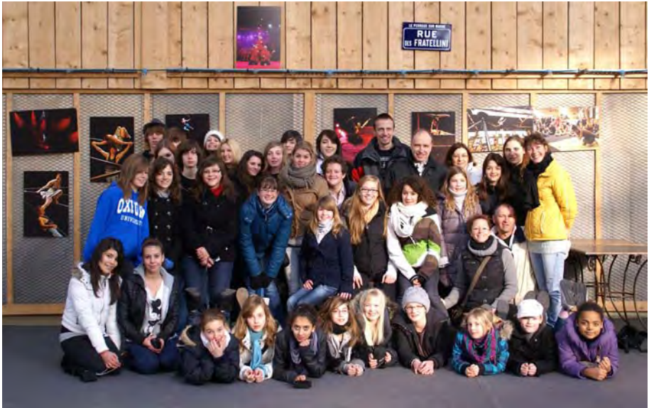
Visite de l'Académie Fratellini