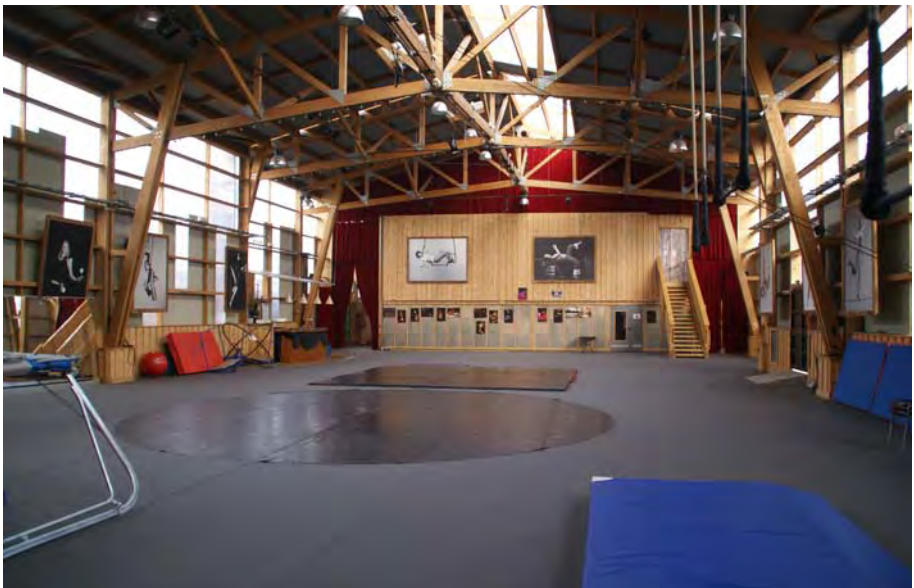
Des salles comme ça, y en a plusieurs ! On rêve...