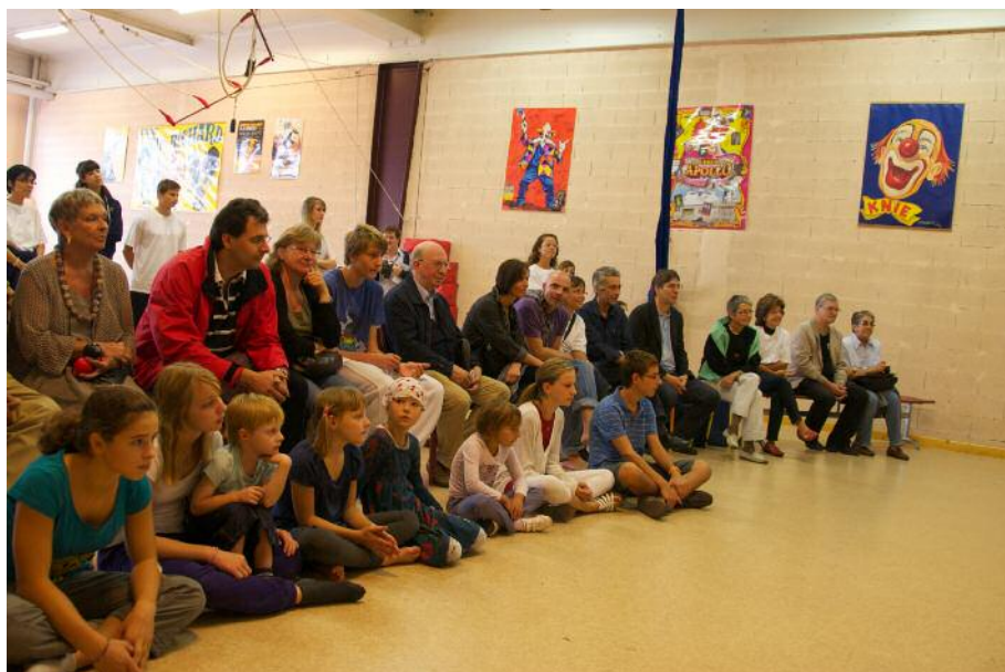
Le spectacle des échelles a l'air captivant