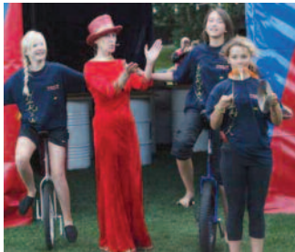
Des acrobates et des artistes d'une école de cirque relèvent le défi.