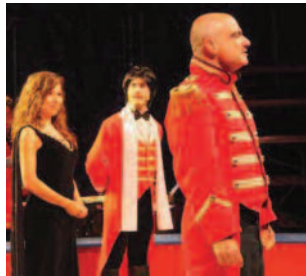
Cinq comédiens professionnels seront présents.