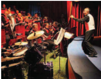
L'ensemble de cuivres va jouer dans un chapeau. Plutôt insolite!