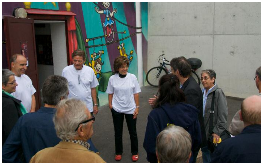
et les discussions avec les officiels plutôt sympathiques