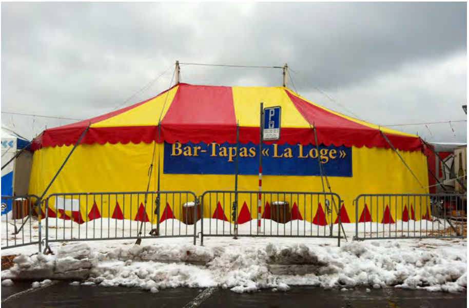
Notre chapiteau transformé en bar à Vevey