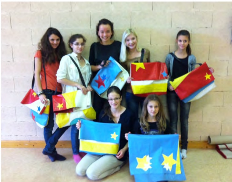
Et voilà le résultat! Joli non ?