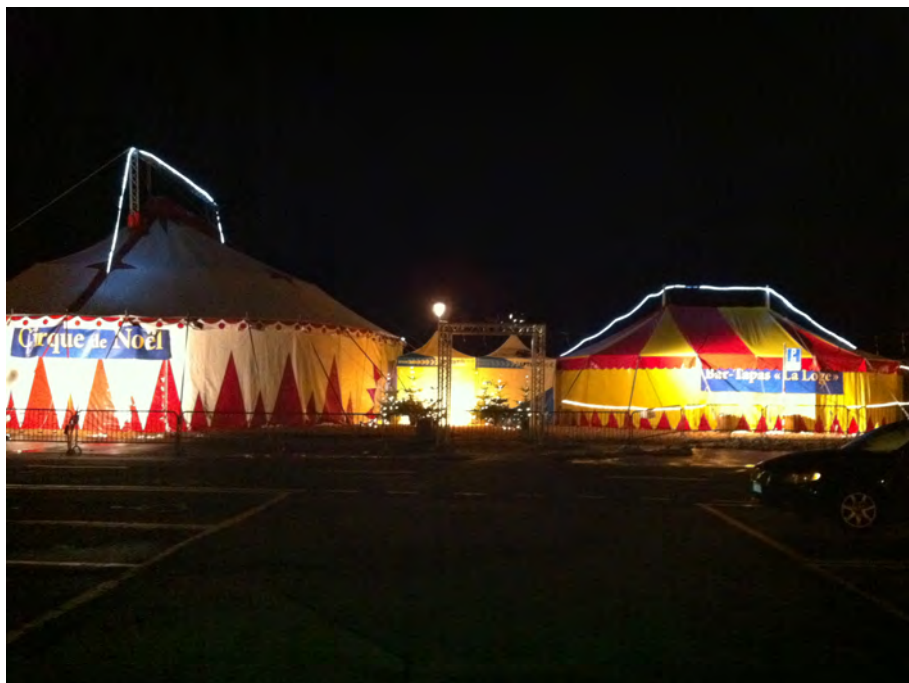
Le cirque de Noël de Vevey