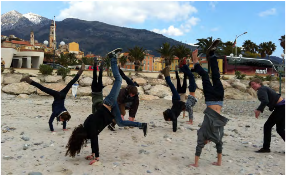
Même là on fait du cirque...