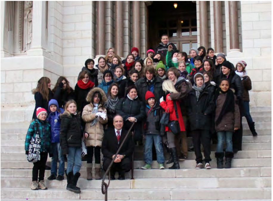
Et voilà nos touristes à Monaco