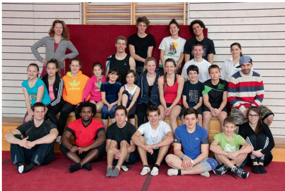
L'équipe à Aigle