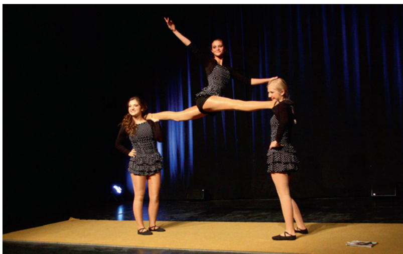
... et les plus grandes