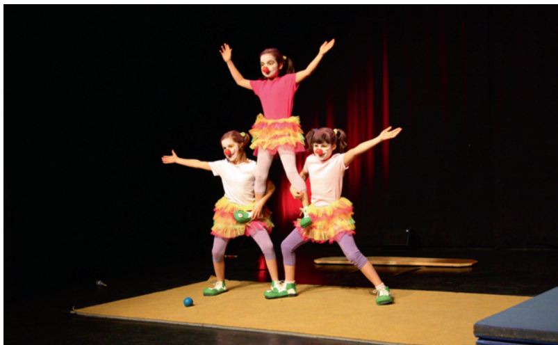
Petites clownesses acrobates à l'AG

Le 21 : Spectacle pour l'AG de l'Association des Amis de l'ECL qui cette année a eu lieu à la Maison de Quartier de Chailly, magnifique salle où nous avons accueilli plus de soixante personnes (un record pour une AG), inutile de dire que le succès était assuré pour ces artistes. Merci aux parents et amis participants.